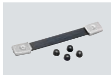
MB-23 TRAGEGRIFF Mit vier Gummifüßen, zur Montage an der Seitenfläche des Gehäuses