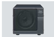
SP-21 EXTERNER LAUTSPRECHER Impedanz: 8 Ω max. NF-Leistung: 5 W