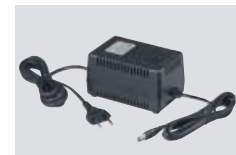
AD-55 NETZADAPTER Für den Betrieb des Empfängers am 220-V-Wechselstromnetz