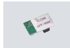
UT-102 SPRACHSYNTHESIZER Zur Ansage der Frequenz (englisch und japanisch wählbar)