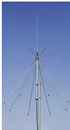
AH-7000 BREITBAND-DISCONE-ANTENNE Frequenzbereich: 25 bis 1300 MHz

Verschiedene Zubehörteile sind in einzelnen Ländern möglicherweise nicht verfügbar.