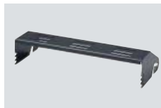
IC-MB12 MOBILHALTERUNG Für Mobilbetrieb; Winkel einstellbar