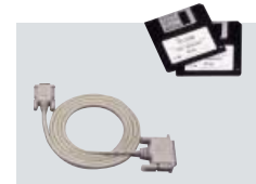
RS-R8500 FERNSTEUER-SOFTWARE Zur Fernsteuerung des IC-R8500 über einen PC