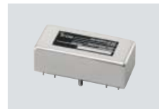
FL-52A SCHMALBAND-CW-FILTER Mittelfrequenz: 455 kHz Bandbreite: 500 Hz (–6 dB)