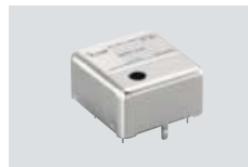
CR-293 QUARZOFEN (TCXO) Frequenzstabilität: ±0,5 ppm bei 0 °C bis +60 °C